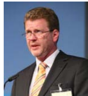
Staatssekretär Dr. Marcel Huber

Als Repräsentant der Bayerischen Staatsregierung hielt Staatssekretär Dr. Marcel Huber vom Ministerium für Umwelt, Gesundheit und Verbraucherschutz die Eröffnungsrede. Er betonte die Bedeutung von Kooperationen als Treiber für Innovationen für das Gesundheitswesen und zeigte sich beeindruckt von der begleitenden Ausstellung.